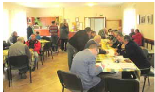
Megtartotta tavaszi közgyűlését a Túravitórlás Egyesület.